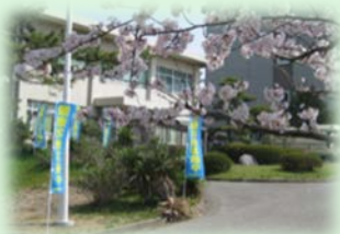
保健管理センター 外観